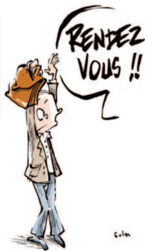
RENDEZ-VOUS DE CARRIÈRE

“ Aujourd'hui, j'ai reçu l'appréciation finale de l'IA-DASEN : « Satisfaisant » alors que ma note d'inspection est de 18/20 et que dans le tableau il y avait coché (4 satisfaisants – 6 très satisfaisants et 1 excellent) et que l'appréciation de l'IEP était très bonne. Sur quels critères s'est-elle arrêtée ?